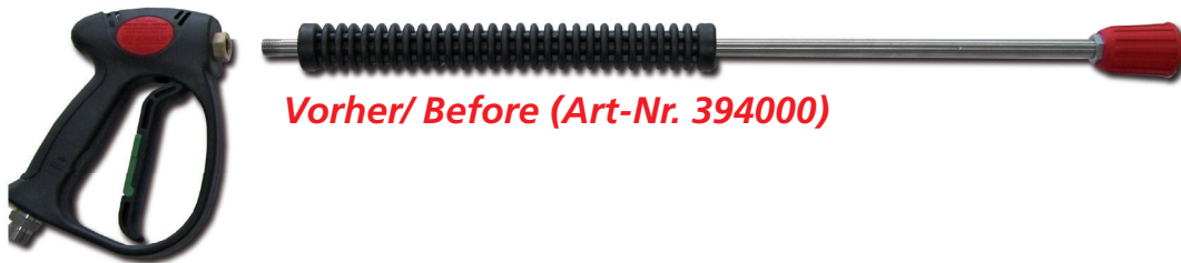
Vorher/ Before (Art-Nr. 394000)