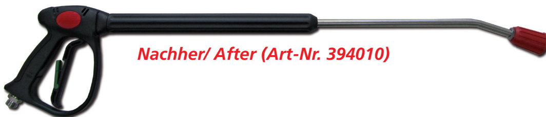
Nachher/ After (Art-Nr. 394010)